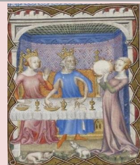
la danse de Salomé lors du banquet pour l'anniversaire d'Hérode. Elle danse devant sa mère Hérodiade et Hérode. Elle demandera que Jean-Baptiste soit décapité.