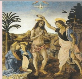
le baptême du Christ avec le mystère de la Sainte Trinité : le Père, le Fils et le Saint-Esprit.

Découvrir ou redécouvrir la vie et le rôle de Jean-le-Baptiste, sa naissance miraculeuse, la Visitation, sa prédication et le baptême du Christ avec le mystère de la Sainte-Trinité. Sa fin tragique, décapité sur l'ordre d'Hérode.